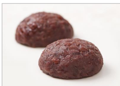
『おはぎ (つぶ)』 (税込 140 円/1 個)

安全で安心して召し上がっていただけるとして、毎日のおやつや、ちょっとした手土産など、お子様からご年配の方まで幅広くご愛顧いただいております。