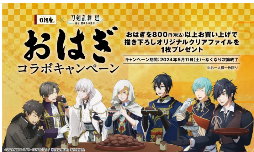
口福堂×「刀剣乱舞 廻」おはぎコラボレーション企画“描き下ろしオリジナルクリアファイル”プレゼント

明治4年(1871年)、牛鍋店を創業以来、150余年の歴史を誇る肉の老舗、株式会社柿安本店(本社：三重県桑名市/代表取締役社長：赤塚保正、以下：柿安)の和菓子ブランド「口福堂」は、毎週火曜日23:00からTOKYO MX、BS11にて放送中のアニメ『刀剣乱舞 廻-虚伝 燃ゆる本能寺-』とおはぎコラボレーション企画を実施いたします。