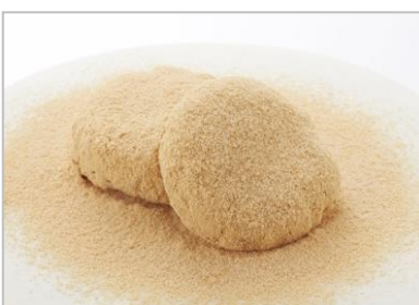
『おはぎ (きなこ)』 (税込 140 円/1 個)