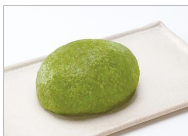
『おはぎ (ずんだ)』 (税込 194 円/1 個)