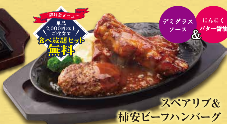
スペアリブ & 柿安ビーフハンバーグ