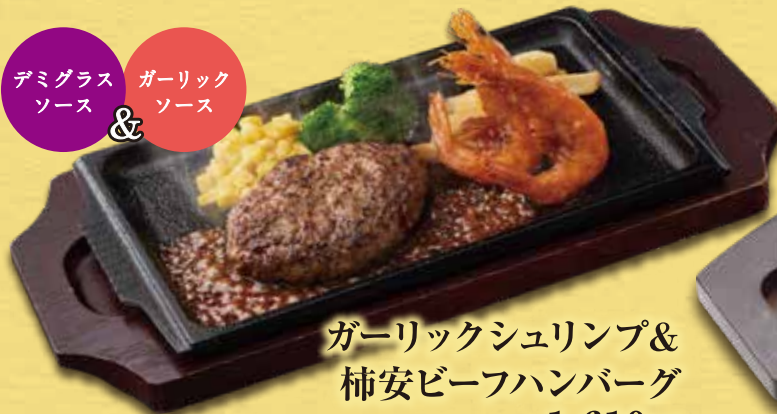
ガーリックシュリンプ & 柿安ビーフハンバーグ