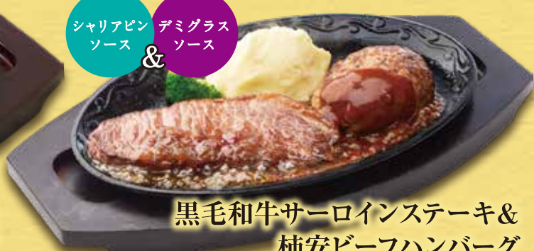
黒毛和牛サーロインステーキ & 柿安ビーフハンバーグ