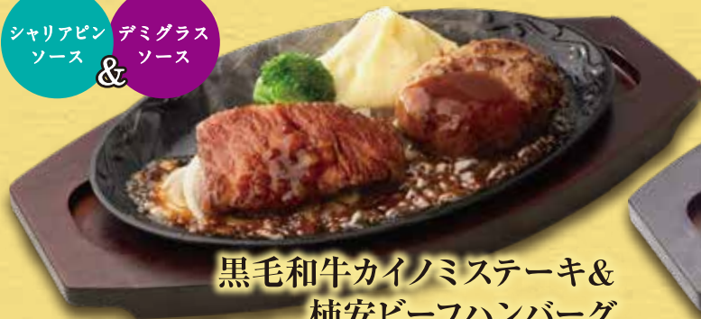
黒毛和牛カイノミステーキ & 柿安ビーフハンバーグ